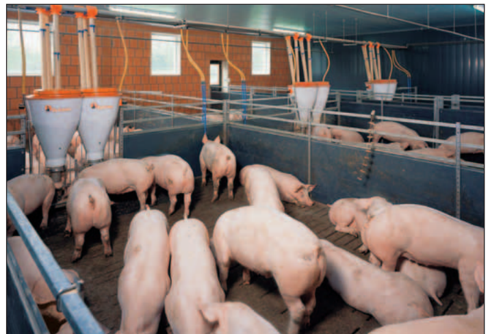
Stor gruppesti med slagtesvin, hvor der anvendes PigNic-Jumbo