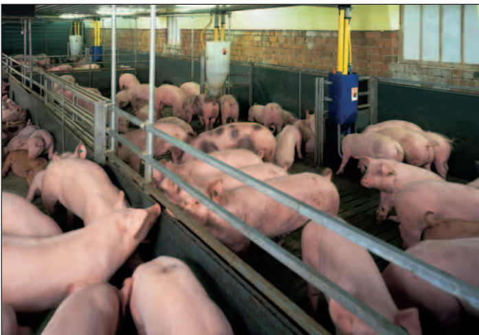
Skillevægge med selektionsdøre letter kontrollen med dyrene og selektionen